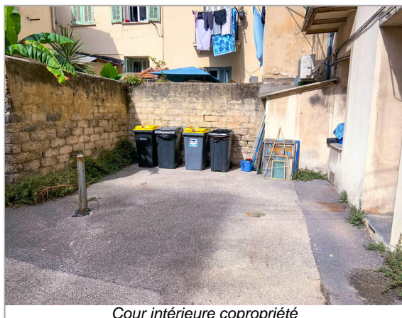
Cour intérieure copropriété